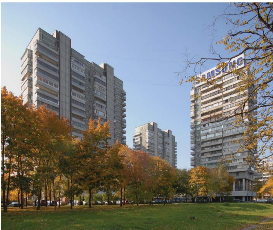
Жилой комплекс «Лебедь»

Ассоциированный иностранный член Американского Института Архитекторов (Int'l. Assoc. AIA).