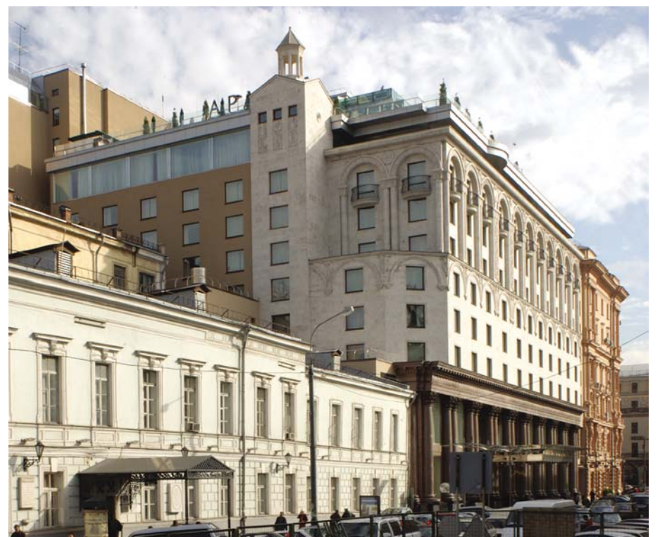
Гостиница «Арарат Парк Хаятт Москва»