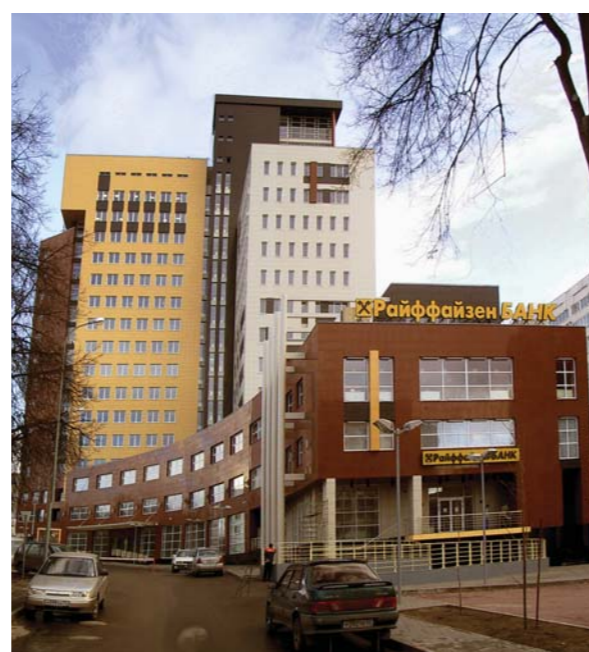
Бизнес-центр «Столица-Нижний» ул. Горького, г. Нижний Новгород, 2005 г. Архитекторы: А. Худин, М. Потапов

Александр Александрович – автор более 50 научных трудов, проводит исследования по темам: