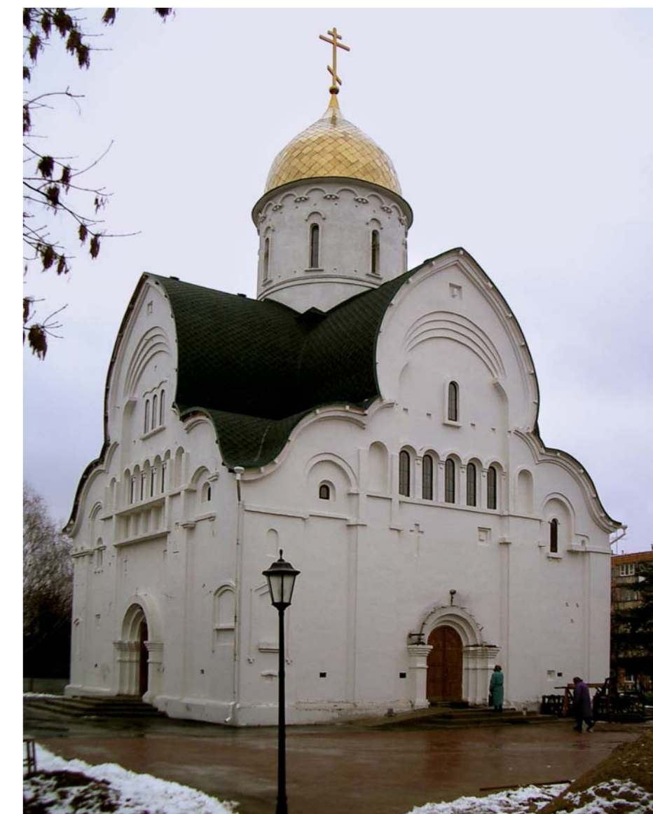
Церковь в честь Иконы Оранской Божьей Матери, ул. Бекетова, г. Нижний Новгород. 2005 г. Архитекторы: А. Худин, при участии: О. Гаврилова, О. Орельской, С. Рачковой

Среди построенных объектов можно отметить бизнес-центр «Столица-Нижний» на ул. Горького, общественно-жилой комплекс «Покровские ворота» на ул. Б. Покровской, церковь в честь Иконы Оранской Божьей Матери на ул. Бекетова, жилой комплекс «Подкова» на ул. Гаражной, жилые дома на ул. Белинского. Среди важнейших проектных задач – Дом Правительства Нижегородской области в Нижегородском Кремле, первая очередь которого находится в стадии строительства. НПП «Архитектоника» неоднократно получала приглашения к участию в заказных конкурсных проектах как одна из ведущих проектных организаций Нижнего Новгорода.